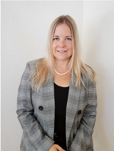
Bild der Autorin